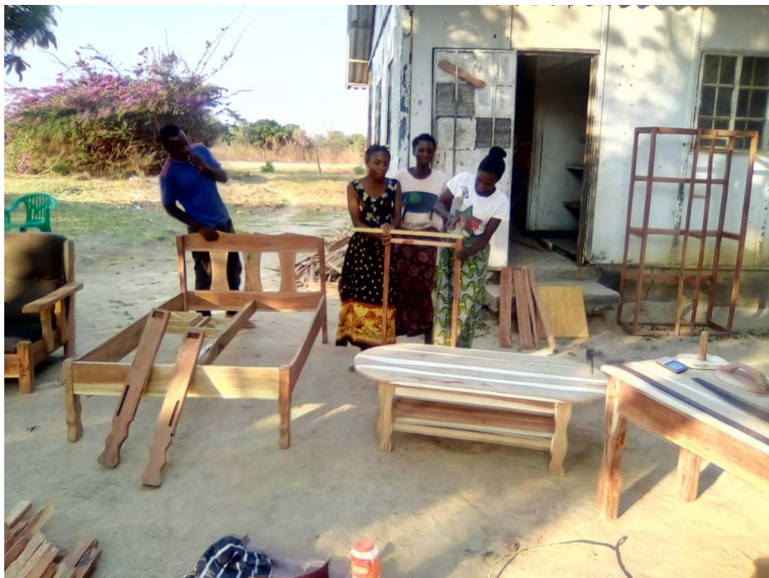
Truhlářské kurzy mladých