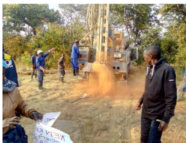
Realizace vodních vrtů