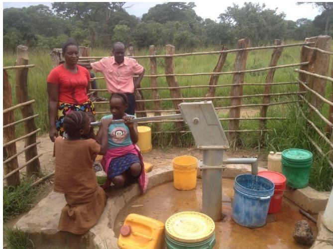
Nabírání vody u vrtu