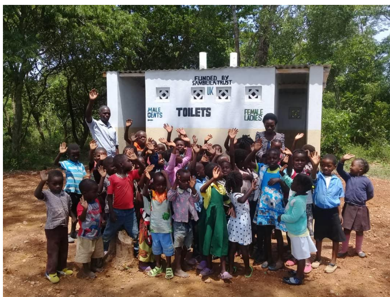
Nové toalety pro učitele v Christine Nursery School